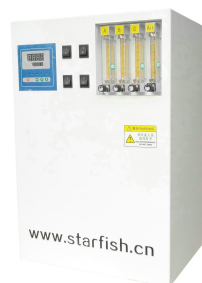
CO 2 加富器/酸化仪